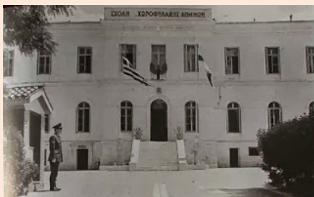
Η κεντρική είσοδος της Σχολής Χωροφυλακής Αθηνών που το Δεκέμβριο του 1944 αντιστάθηκε ηρωικά στις επιθέσεις των ΕΛΑΣιτών.

του περιβόλου. Αυτό δημιουργούσε αρκετούς κινδύνους. Πρώτον, οι ΕΛΑΣίτες καταλαμβάνοντας τις πολυκατοικίες θα εδέσποζαν του στρατοπέδου με αποτέλεσμα να μπορούν να εκτοξεύουν πυρά ακριβείας καθώς και χειροβομβίδες, μασούρια με δυναμίτη και εμπρηστικές αυτοσχέδιες βόμβες εναντίον του διοικητηρίου και των λοιπών κτισμάτων. Δεύτερον, τα εφαιπτόμενα κτίρια θα μπορούσαν να χρησιμοποιηθούν ως συγκεκαλυμμένες οδοί διείσδυσης στο στρατόπεδο με την επίτευξη ανοιγμάτων στους τοίχους τους που εφάπτοντο του περιβόλου.