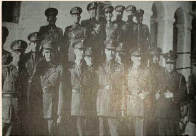
Αξιωματικοί της Χωροφυλακής και του Στρατού που συμμετείχαν στην άμυνα του Μακρυγιάννη. Τέταρτος από αριστερά διακρίνεται ο διοικητής του Συντάγματος Γεώργιος Σαμουήλ.

Παιδιά μου, σήμερα ή αύριο θα αντιμετωπίσουμε πολυάριθμο, επικίνδυνο και καλά εξοπλισμένο εχθρό, φανατικό στην εγκληματική του ιδεολογία. Πρέπει να αγωνιστούμε όλοι μας με την ίδια αποφασιστικότητα και την ίδια πίστη που επέδειξε το σώμα της Χωροφυλακής από τα παλιά χρόνια μέχρι σήμερα. Πιθανόν να υποχρεωθούμε να αμυνθούμε μέχρι εσχάτων, και πιθανόν να χρησιμοποιήσωμεν και την λόγχη, ακόμα και να έλθωμεν σώμα με σώμα με τους κομμουνιστές. Η θυσία για την πατρίδα πρέπει να μας εμπνέει και το υπέρτατο χρέος προς την τιμή των όπλων μας, πρέπει να μας οιστρηλατεί. Καμιά ανθρώπινη δύναμη στον κόσμο δεν είναι δυνατόν να μας λυγίσει και να μας υποτάξει, όταν έχουμε μπροστά μας το παράδειγμα των Σουλιωτών και των πολιορκημένων του Μεσολογγίου, που αναγκάστηκαν να τρέφονται και με φύλλα δένδρων ακόμα για να μην παραδοθούν. Η Ελληνική ιστορία είναι γεμάτη από δάκρυα και αίμα, ηρωισμούς και θυσίες. Γι' αυτό συνεχίζει τον ένδοξο δρόμο της η αθάνατη αυτή φυλή που λάτρεψε την ανδρεία και θεοποίησε την παλικαριά. Δεν θα λογαριάσουμε τον αριθμό των αντιπάλων μας. Τον Οκτώβριο του 1940 το ίδιο πράξαμε. Η ανδρειωμένη ψυχή της φυλής μας δεν λογάρισε τα εκατομμύρια των λογχών του εχθρού, γιατί η παλικαριά δεν μετριέται με τον πήχη, ούτε ζυγίζεται. Δημιουργεί, εξυψώνει και επιτυγχάνει θαύματα. Ο εχθρός δεν πρέπει να καταλάβει το οχυρό μας.