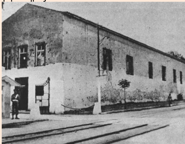
Η νότια πύλη του στρατοπέδου Μακρυγιάννη.