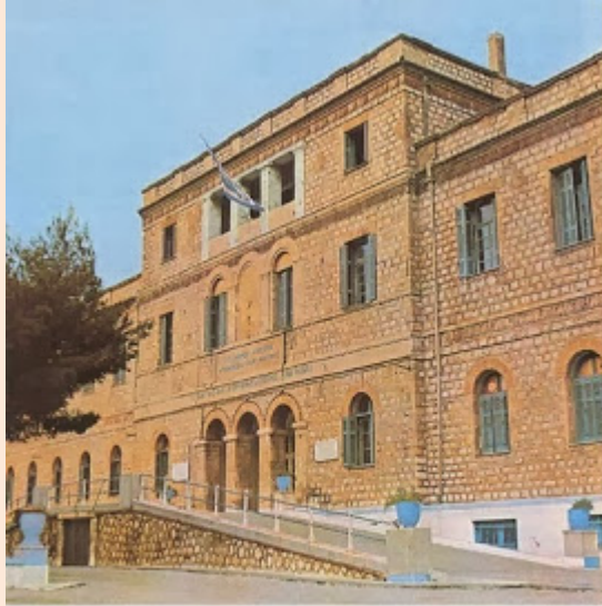
Το κεντρικό κτίριο του Συντάγματος Χωροφυλακής Μακρυγιάννη εν έτει 1973, όπου ακόμη στέγαζε την ανωτέρω μονάδα της Χωροφυλακής.

Τον Δεκέμβριο του 1944 η Ελλάδα είχε απελευθερωθεί από τον γερμανικό ζυγό και ο πόλεμος είχε απομακρυνθεί στην καρδιά πλέον του Γ' Ράιχ, αλλά οι δοκιμασίες δεν είχαν τελειώσει όπως πίστευαν οι απλοί καθημερινοί άνθρωποι. Ένας νέος πόλεμος είχε ξεκινήσει μεταξύ δύο παγκοσμίων στρατοπέδων: του Δυτικού, που εκπροσωπούσε έναν δημοκρατικό τύπο εξουσίας και του Ανατολικού — κομμουνιστικού, που εκπροσωπούσε έναν ολοκληρωτικό τύπο εξουσίας. Η Σοβιετική Ένωση είχε κατορθώσει, στα περισσότερα ευρωπαϊκά υπό κατοχή κράτη, να ελέγξει τα αντιστασιακά κινήματα καθώς τα παράνομα κομμουνιστικά κόμματα είχαν άρτια συνωμοτική οργάνωση. Οι ανταρτικές δυνάμεις των κομμουνιστικών κομμάτων, στις χώρες που περιήλθαν υπό την επιρροή της ΕΣΣΔ, χρησιμοποιήθηκαν για να καταλάβουν την εξουσία και να επιβάλλουν ολοκληρωτικά κομμουνιστικά καθεστώτα που συμμάχησαν με την Ρωσία. Στις υπόλοιπες ευρωπαϊκές χώρες τα όπλα των ανταρτών παραδόθηκαν στις νόμιμες κυβερνήσεις που ανέλαβαν την εξουσία.