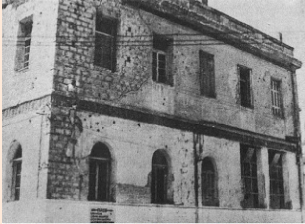
Η ανατολική πλευρά του Διοικητηρίου του Συντάγματος Μακρυγιάννη, όπου διακρίνονται οπές από τις βολίδες των κομμουνιστών. Η σκεπή (που δε φαίνεται) έχει καταρρεύσει από βολές όλμων

Μετά την παρέλευση λίγων δευτερολέπτων ένας καταιγισμός από πυρά αυτόματων όπλων και τυφεκίων, εκρήξεων χειροβομβίδων, ομαδικών βολών όλμων και πυροβόλων κτύπησε τους στρατώνες της Χωροφυλακής. Το προπαρασκευαστικό αυτό πυρ διήρκεσε επί μιάμιση ώρα αποσκοπώντας στην δημιουργία απωλειών ανάμεσα στους υπερασπιστές του Μακρυγιάννη αλλά και στον κλονισμό τους ώστε να προβάλλουν ασθενική αντίσταση. Ιδιαίτερα καταστρεπτικά ήταν τα πυρά από τα ορειβατικά πυροβόλα των κομμουνιστών που ήταν ταγμένα στους λόφους Αρδήττου και Φιλοπάππου και που εχειρίζοντο έμπειροι Γερμανοί και Ιταλοί λιποτάκτες.