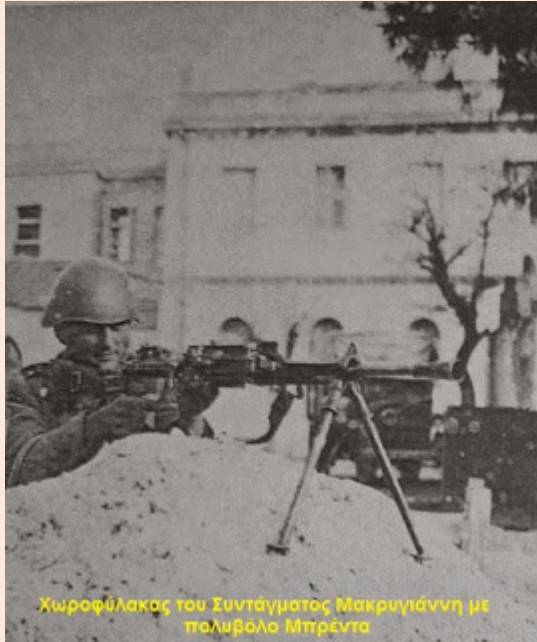
Χωροφύλακας του Συντάγματος Μακρυγιάννη με πυροβόλο Μπρέντα